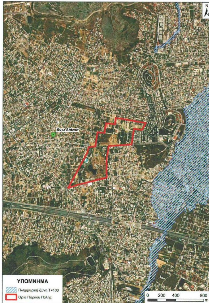
Εικόνα 1. Τοποθεσία του Έργου