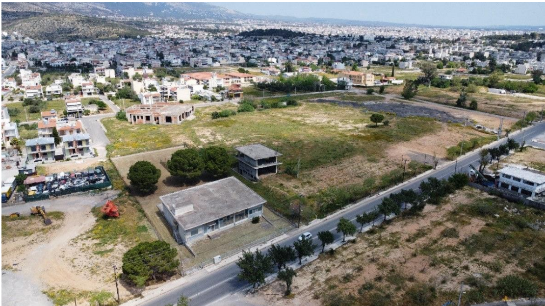
Εικόνα 3. Πανοραμική άποψη του βόρειο τμήματος του Πάρκου Πόλης

Στο βόρειο τμήμα του Πάρκου δεν υπάρχουν κάποιες ιδιαίτερες κατασκευές και χώροι άθλησης. Το μεγαλύτερο τμήμα του είναι υπαίθριος χώρος και δεν υπάρχει σημαντική βλάστηση. Χαρακτηριστικά είναι τα κτήρια του Συλλόγου Ποντίων Φυλής και το Ειδικό Γυμνάσιο Λιοσίων που εντοπίζονται στο κεντρικό τμήμα της περιοχής. Στο νοτιοδυτικό και νοτιοανατολικό άκρο διακρίνονται κάποια ερειπωμένα κτήρια. Η υπόλοιπη περιοχή είναι χέρσα και διακρίνονται ανθρωπογενείς αποθέσεις από διάφορα υλικά και κάποιες κατοικίες.