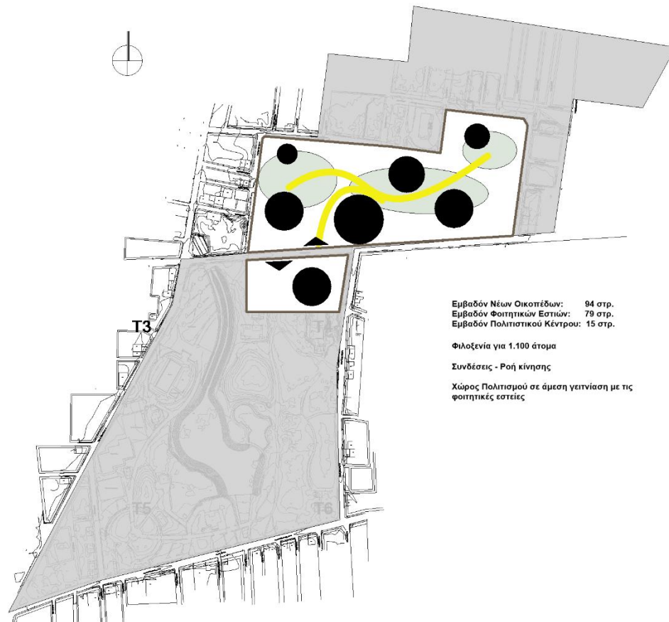
Εικόνα 5. Οργανόγραμμα Χρήσεων

Τα βασικά μεγέθη για τις ΦΟΙΤΗΤΙΚΕΣ ΕΣΤΙΕΣ αφορούν: