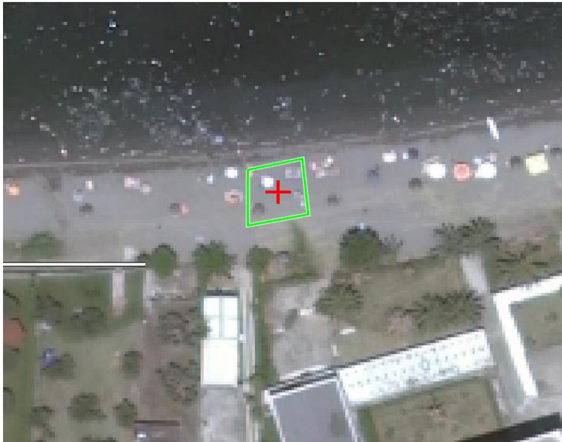
ΦΘΙΩ17 Α ΤΜΗΜΑ