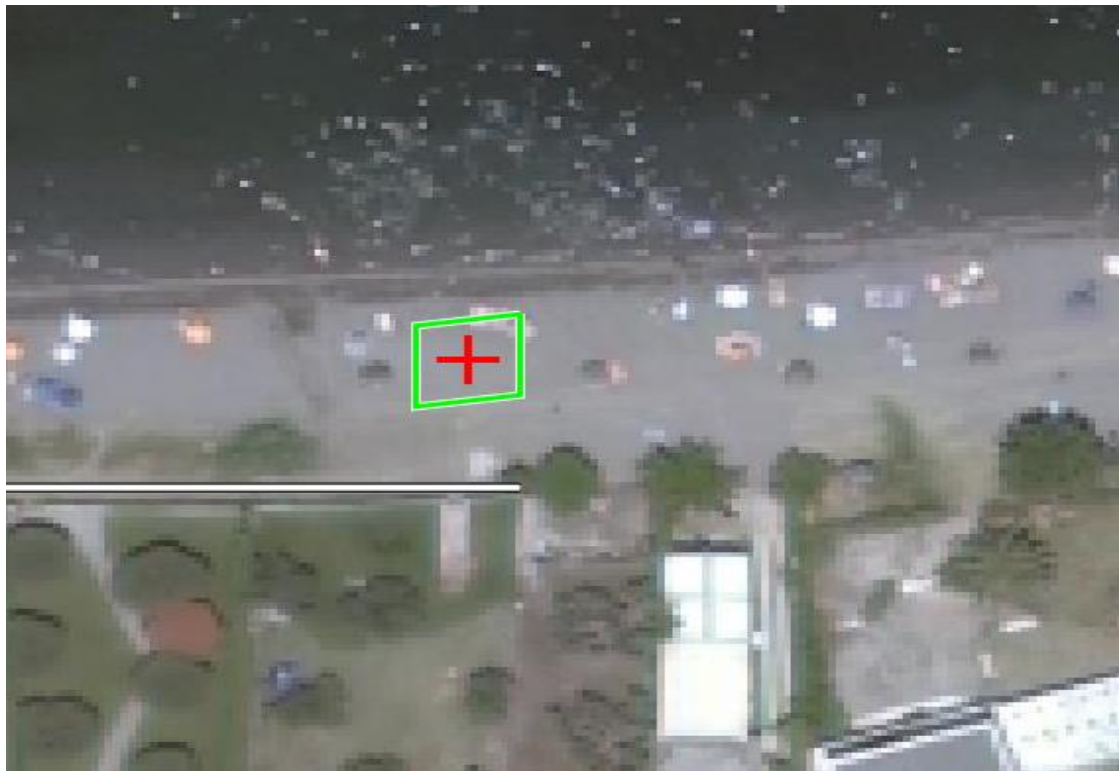
ΦΘΙΩ17 Β ΤΜΗΜΑ