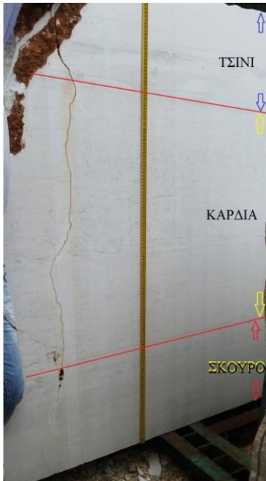
εικ.1: "Σπέσιαλ Κληματιάς"