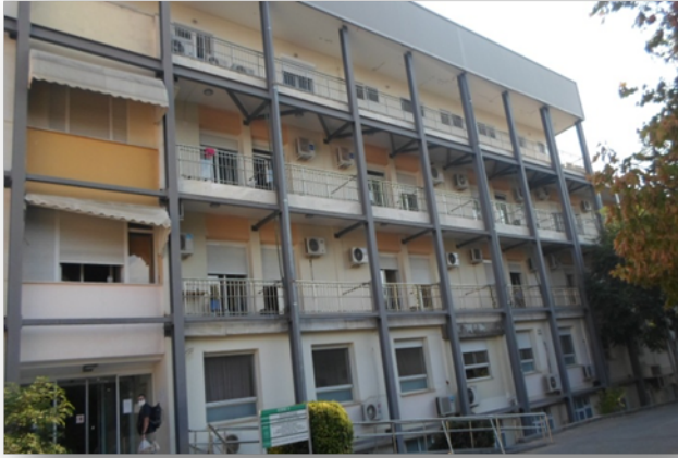
Εικ.1, Υ2 Κτίριο (Προσόψεις Α', Β', Γ' Ορόφου)

Σκοπός του Έργου είναι να αποκατασταθούν οι φθορές, η ασφάλεια, η λειτουργικότητα καθώς και η αισθητική η