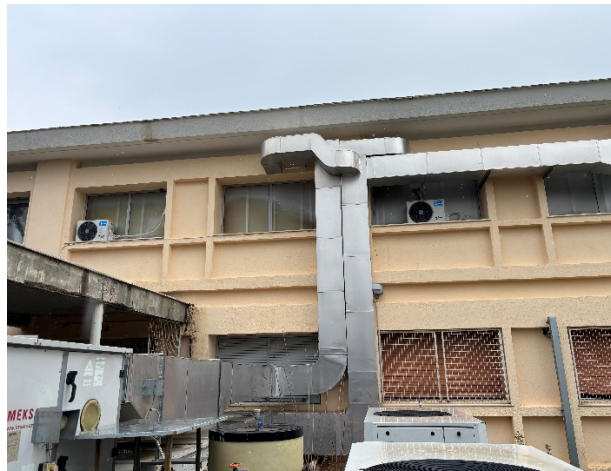
Εξωτερική όψη χώρων ΤΕΠ (φωτ. 7).