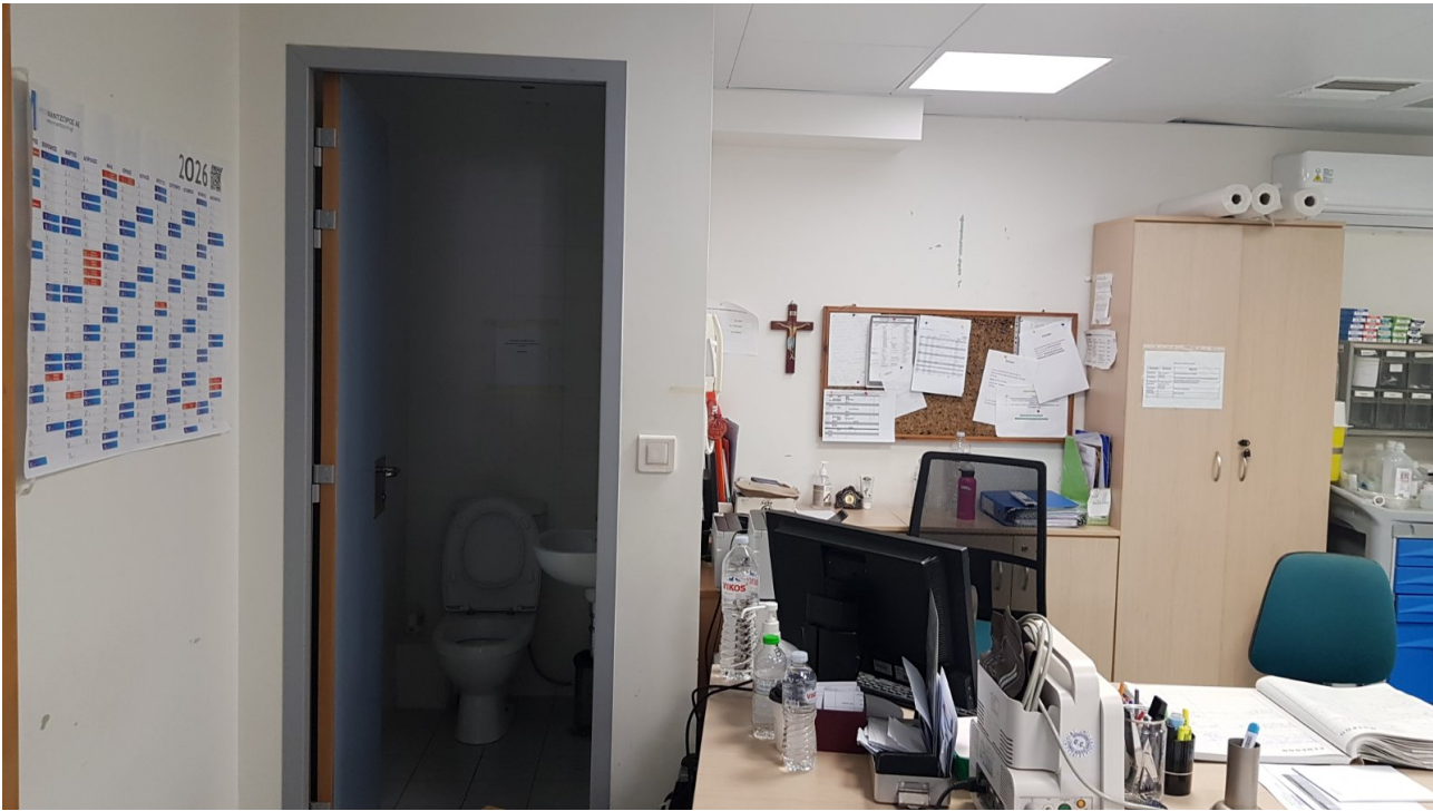
Χώρος w.c. & είδη υγιεινής που θα καθαρευθούν – αποξηλωθούν για την επέκταση του χώρου εφημερίας (φωτ. 2).