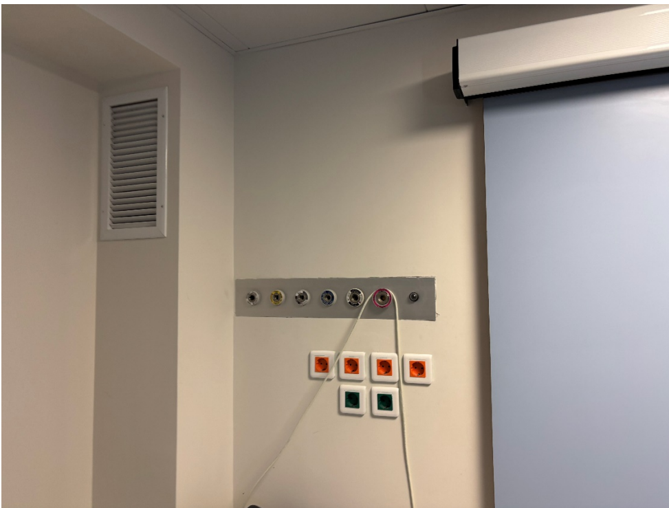
Κοινός τοίχος εφημερίου – χώρου μικρ/κών επεμβάσεων που θα παραμείνει ( φωτ. 3 ).