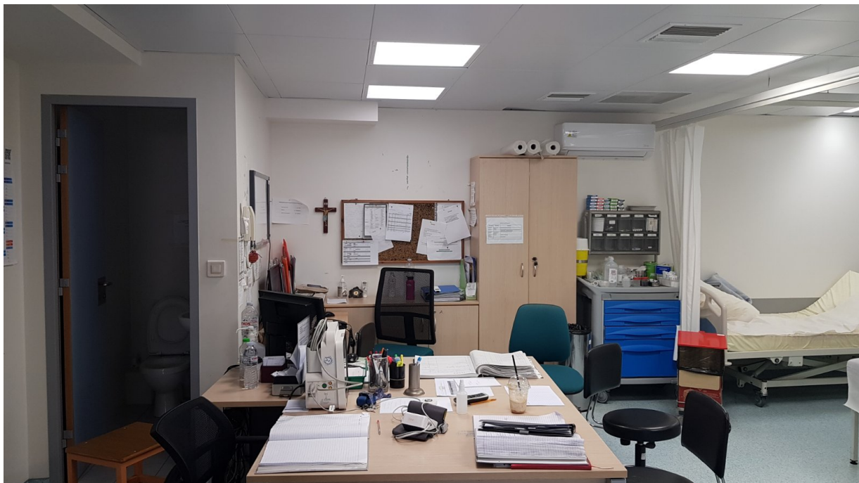
Κύριος χώρος εφημερίου ΤΕΠ ( φωτ. 1).