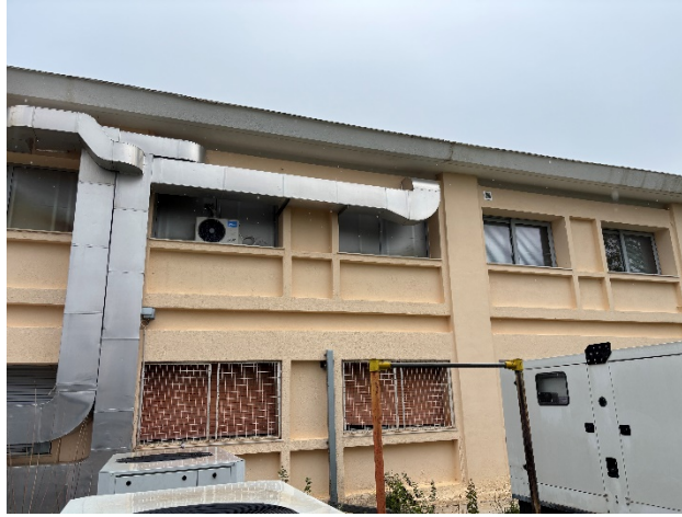
Εξωτερική όψη χώρων ΤΕΠ (φωτ. 6).