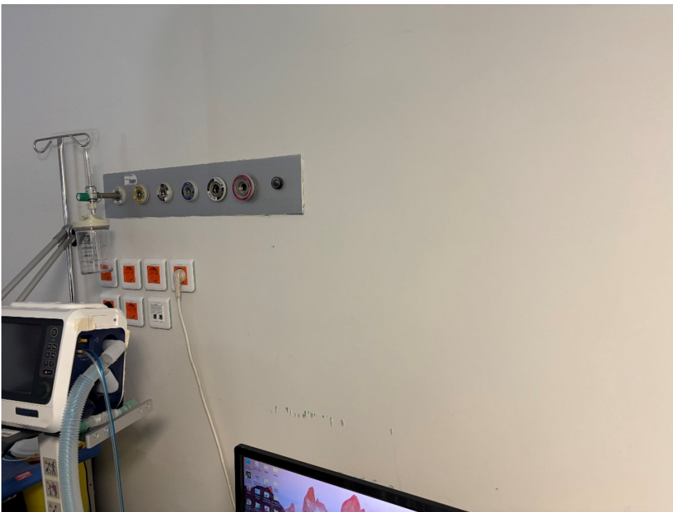
Τοιχοποιία από γυψοσανίδα του χώρου μικρ/σεων του ΤΕΠ που θα αποξηλωθεί εν μέρει για την αντ/ση του εξωτερικού παραθύρου (φωτ. 5).