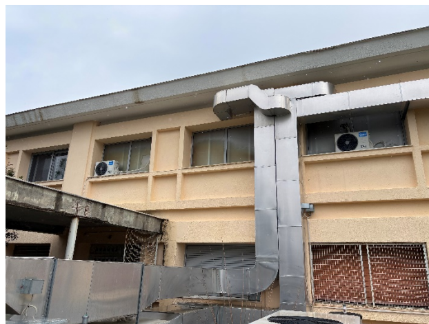
Εξωτερική όψη χώρων ΤΕΠ (φωτ. 8).