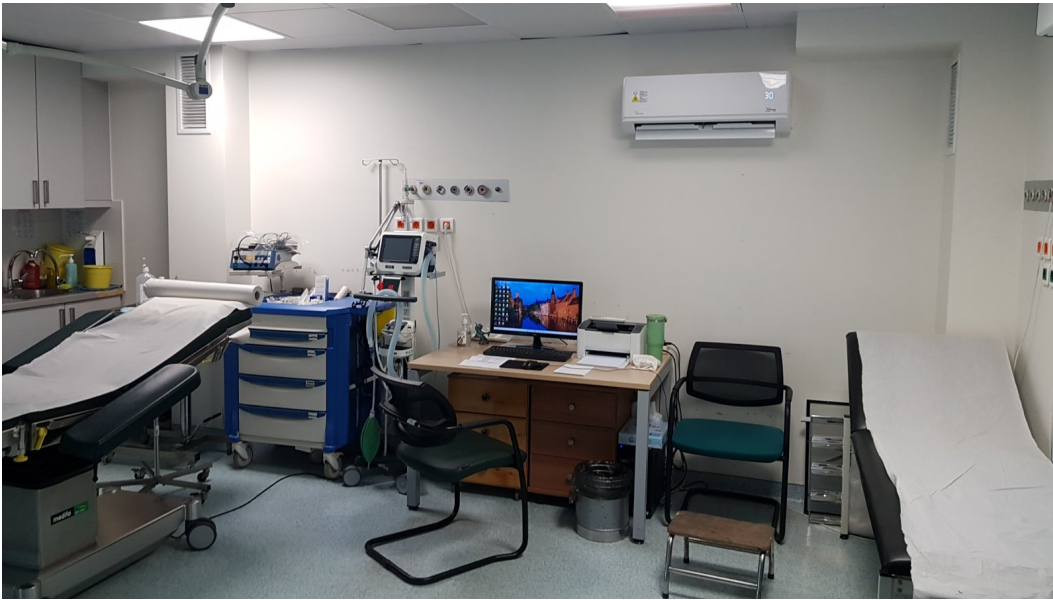
Χώρος μικροεπεμβάσεων του ΤΕΠ που θα αποξηλωθεί η γυψοσανίδα για την αντ/ση του εξωτερικού παραθύρου (φωτ. 4).