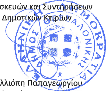
Καλλιόπη Παπαγεωργίου Πολιτικός Μηχανικός ΠΕ

Η Προϊσταμένη της Διεύθυνσης Κατασκευών και Συντηρήσεων Δημοτικών Κτιρίων