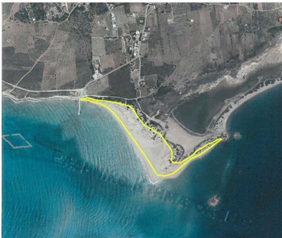
Εικόνα 7: Τοποθέτηση παγίδων συγκράτησης άμμου. Θέση: Πούντα.