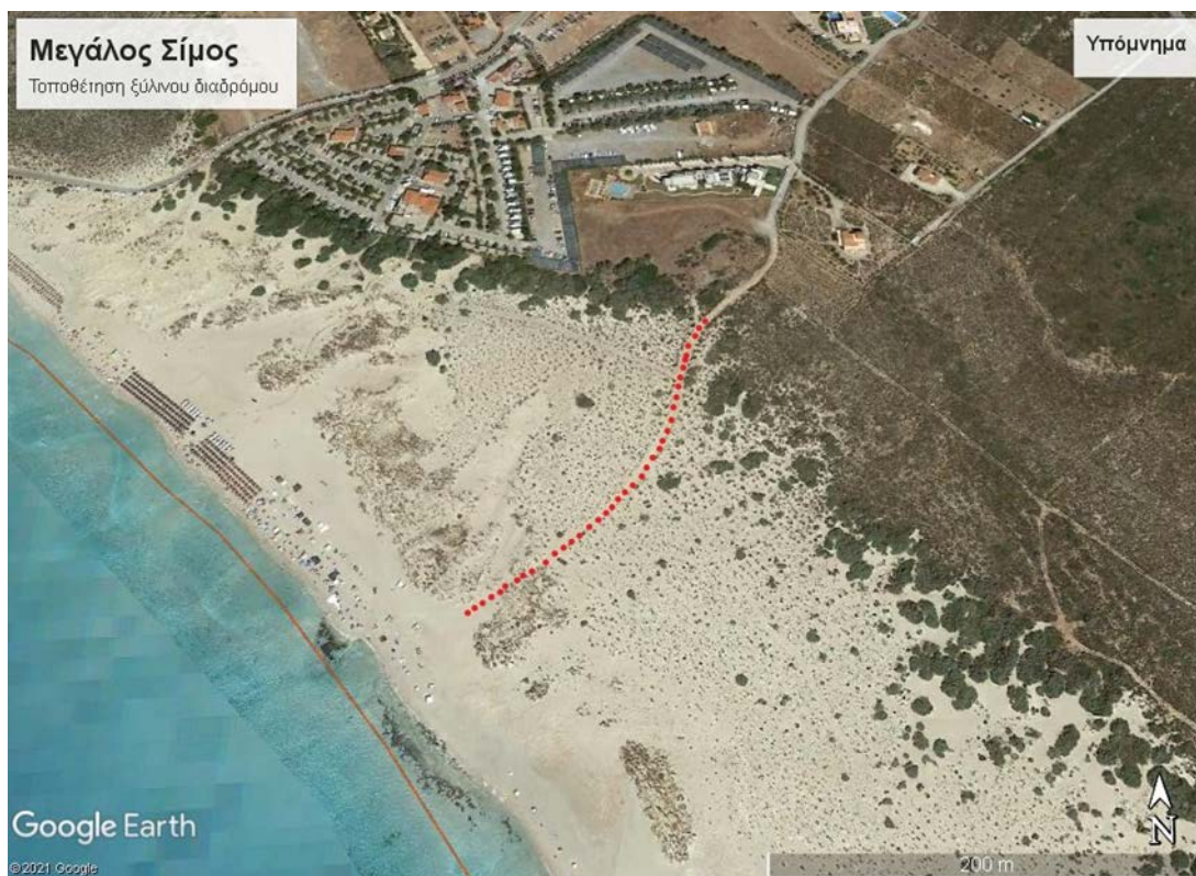
Εικόνα 2: Μεγάλος Σίμος – Θέση τοποθέτησης ξύλινου διαδρόμου.