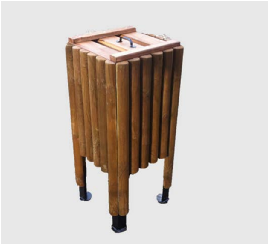
Εικόνα 1: Ενδεικτική φωτογραφία ξύλινου κάδου απορριμάτων.