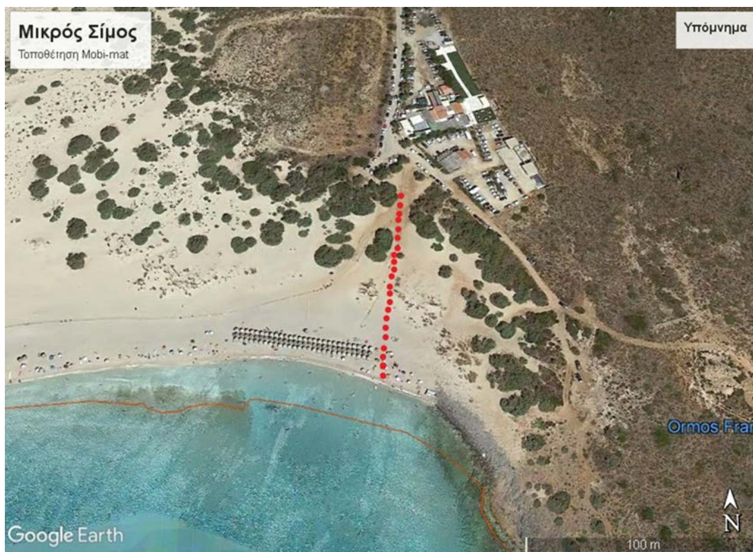
Εικόνα 3: Μικρός Σίμος –Θέση τοποθέτησης ξύλινου διαδρόμου και διαδρόμου AMEA (Mobi -mat).