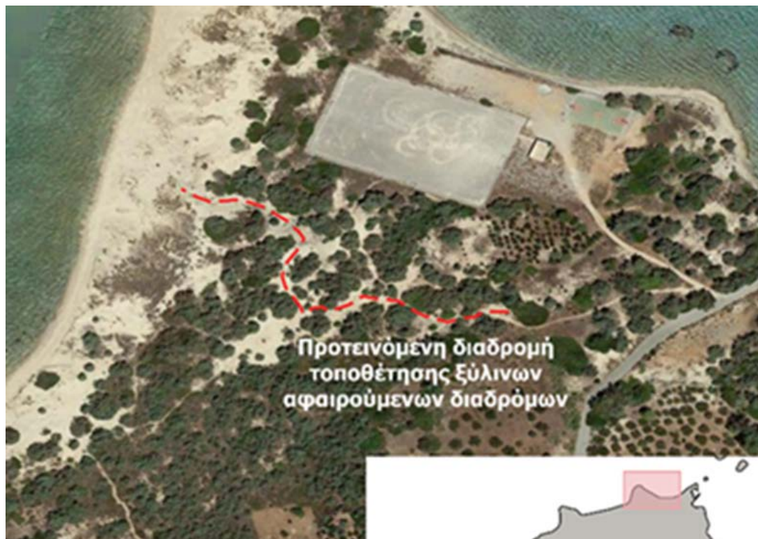
Εικόνα 4: Καλόγερα Ελαφνήσου- Θέση τοποθέτησης ξύλινου διαδρόμου .