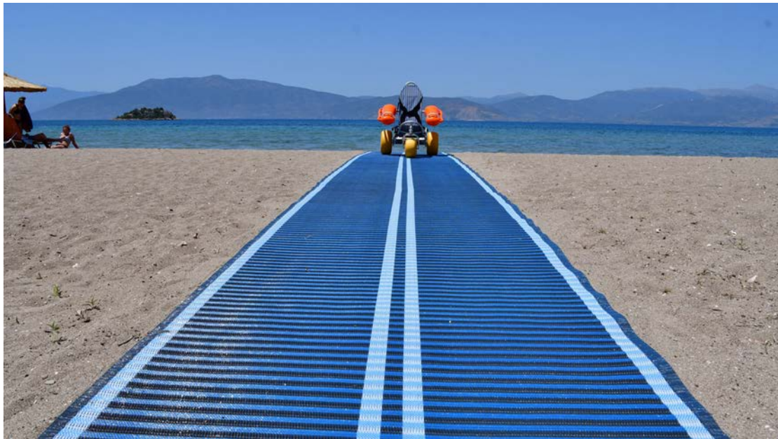
Εικόνα 6: Ενδεικτική φωτογραφία Mobi-Mat ιδανικός για αναπηρικά αμαξίδια.