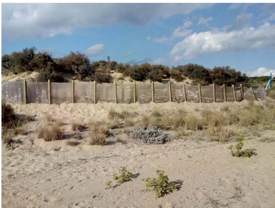
Εικόνα 8: Φωτογραφία από τοποθέτηση ανεμοφραχτών (παγίδων) σε αμμόλοφους.