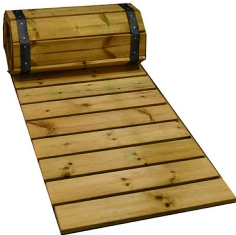
Εικόνα 5: Ενδεικτική φωτογραφία ξύλινου διαδρόμου.