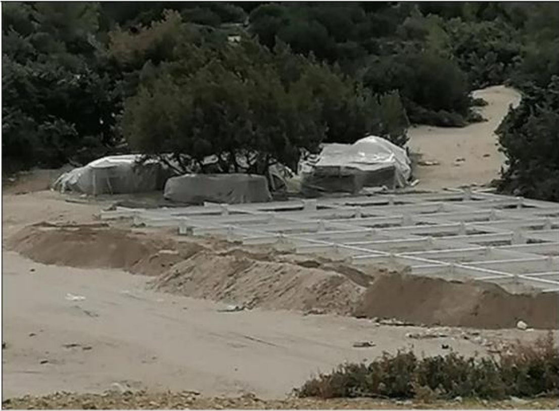
ΦΩΤ. 1 Μεταλλική βάση (θεμελίωση).