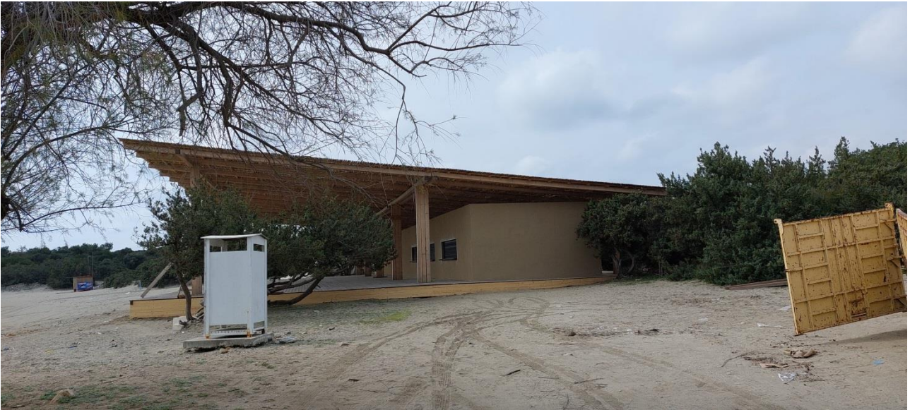
ΦΩΤ. 9 : Τελική μορφή αυθαιρέτου, βορεινή άποψη .