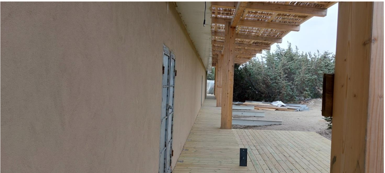
ΦΩΤ.10 : Τελική μορφή αυθαιρέτου, δυτική άποψη .