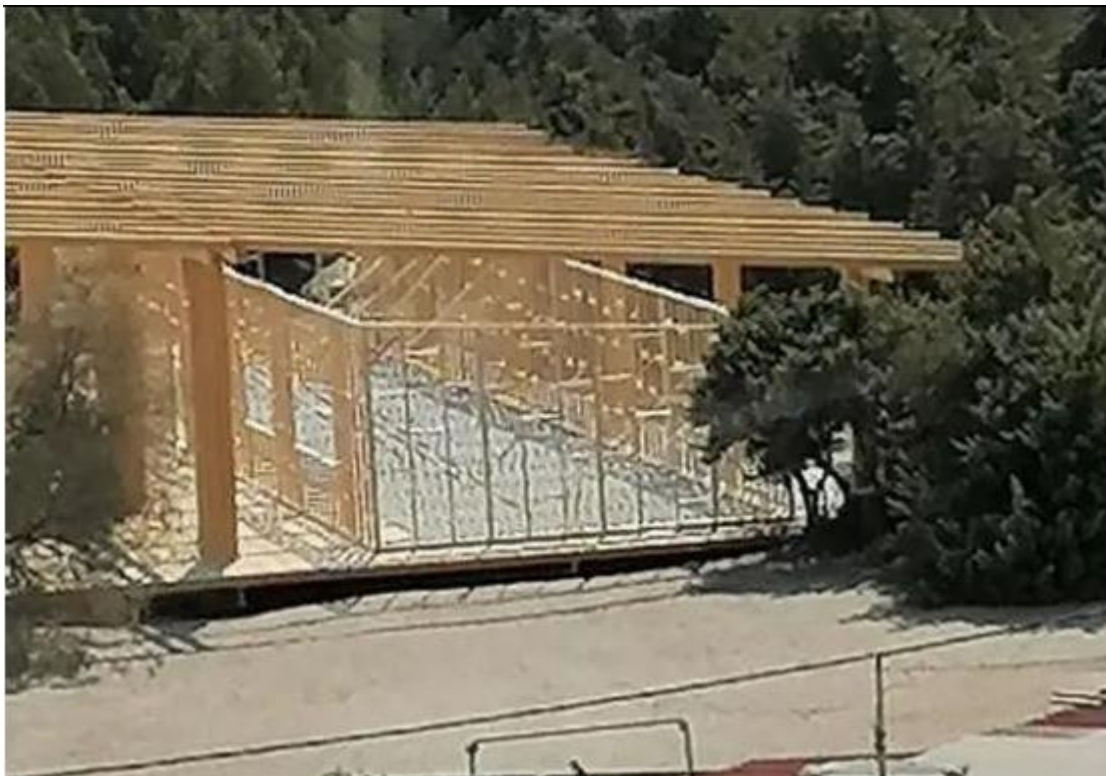
ΦΩΤ. 6. Ξύλινος σκελετός για στήριξη και διαμόρφωση περιμετρικής κάλυψης.