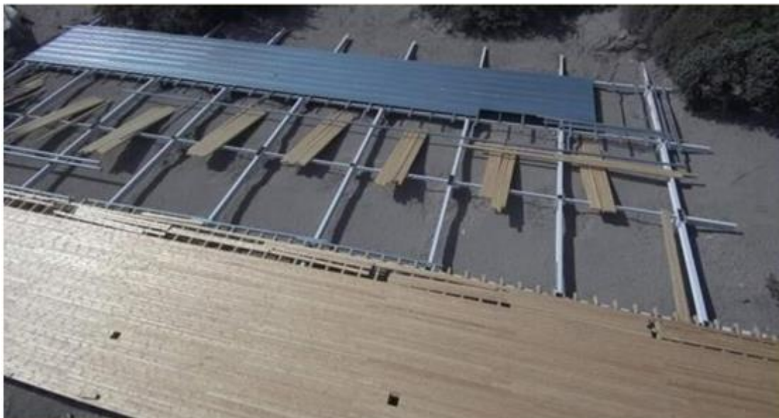
ΦΩΤ. 2. Ξύλινες και μεταλλικές δοκίδες για την διάστρωση του ξύλινου πατώματος και του πατώματος από μεταλλικά στοιχεία.