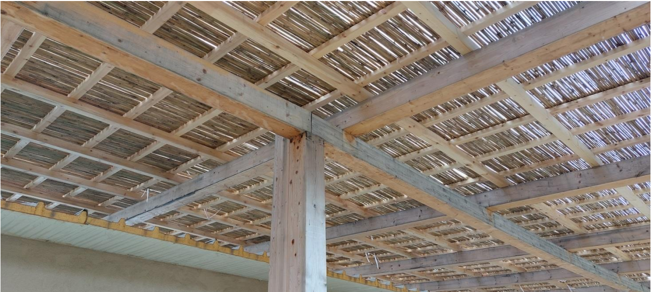
ΦΩΤ. 8. Λεπτομερίες κατασκευής στεγής απο καλάμια και πανελ οροφής κλειστού χώρου