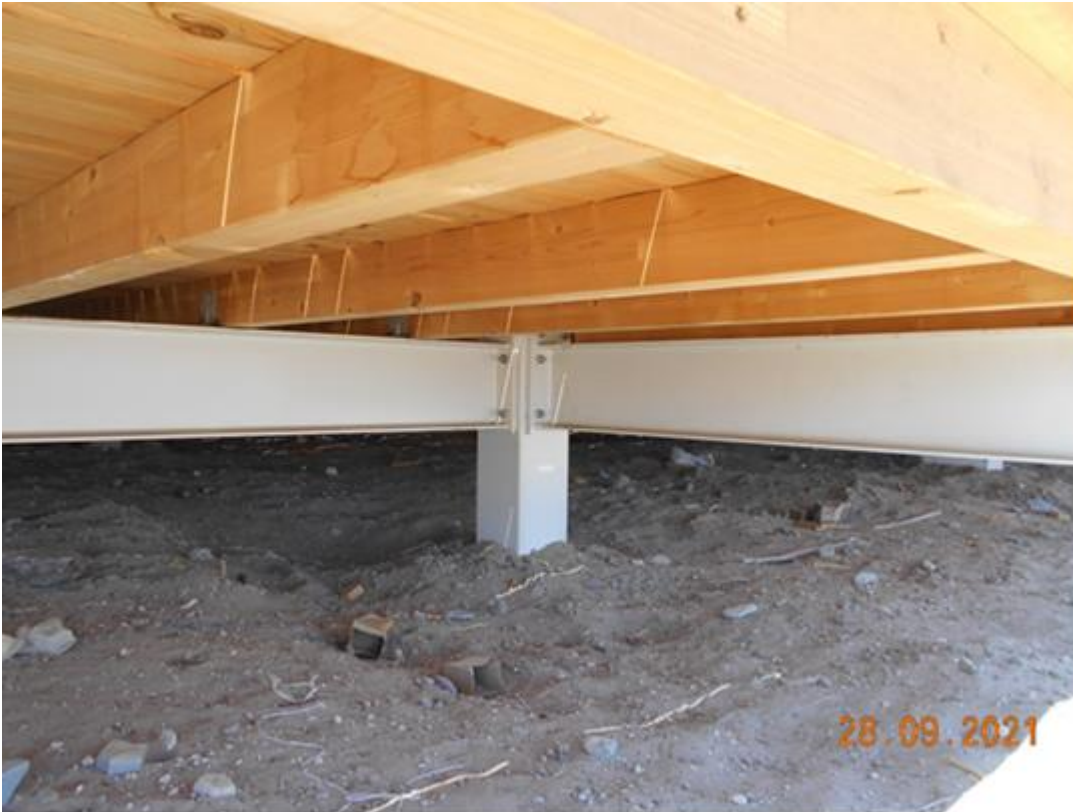
ΦΩΤ. 3. Κατασκευαστική λεπτομέρεια βάθρου εδράσης τύπου (α) μετά των συνθετηρίων μεταλλικών δοκών τύπου ΙΡΕ που σχηματίζουν πλέγμα, πάνω σε αυτά εδράζονται ξύλινες δοκίδες και πάτωμα .