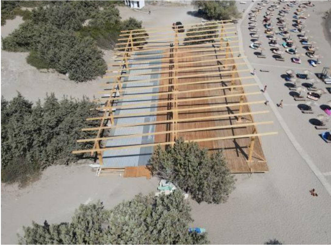
ΦΩΤ. 5. Ξύλινος σκελετός ανωδομής.