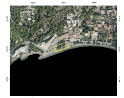
ΑΠΟΣΠΑΣΜΑ ΟΡΘΟΦΩΤΟΓΡΑΦΙΑΣ ΤΗΣ ΕΚΚΑ Α.Ε.