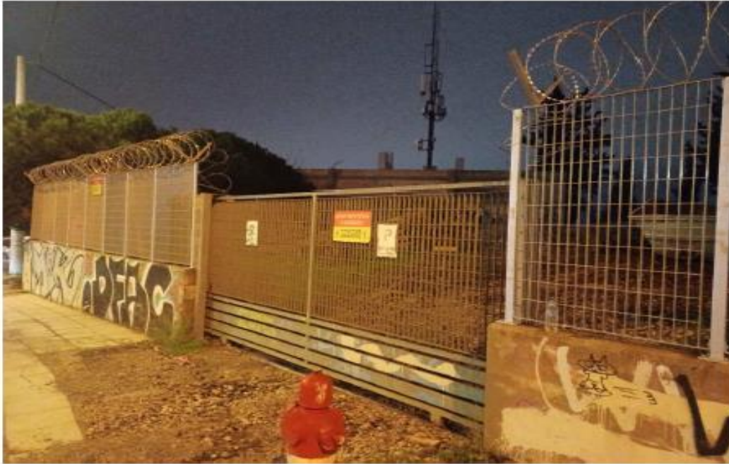
Συρόμενη θύρα στον Υποσταθμό Ειρήνης η οποία θα αντικατασταθεί με συρόμενη θύρα μεγαλύτερου ύψους