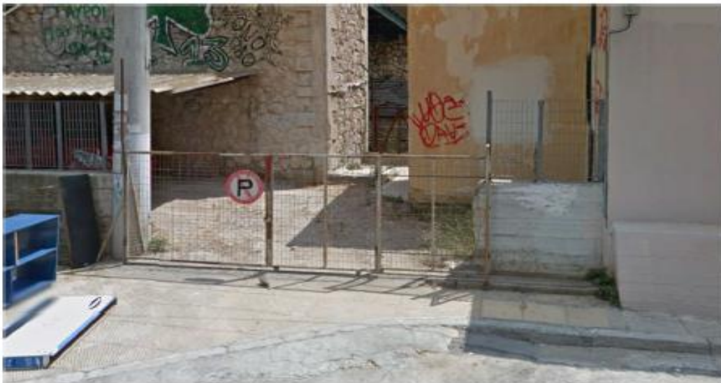
Συρόμενη θύρα στο φυλάκιο στο σταθμό Πετράλωνα η οποία θα αντικατασταθεί με την αποξηλωμένη από το σταθμό Ειρήνη